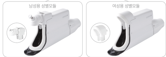
남성용 / 여성용 성별모듈 (선택)