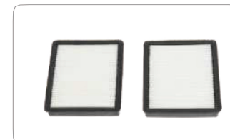
排気口フィルター