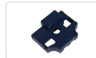
ウォーターフィルター