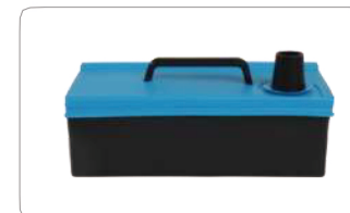
脱臭フィルターボックス