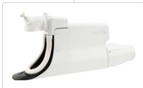
男女別カップモジュールでフィッティングしやすい